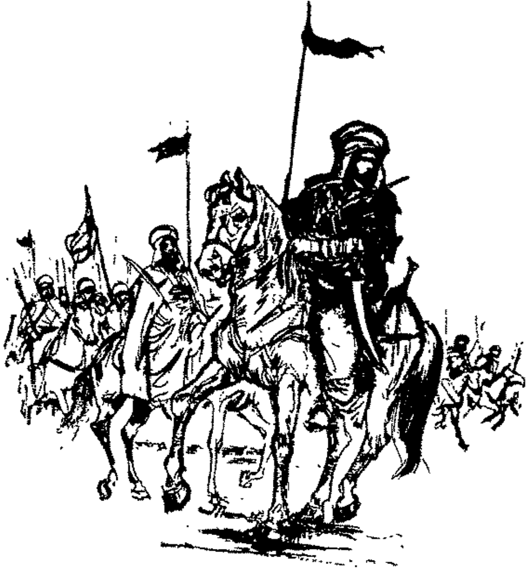
وتقدم سعد بجواده الأبيض . كان في لون إيوان كسرى